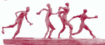
« Les coureurs » d'Isabelle Héraud